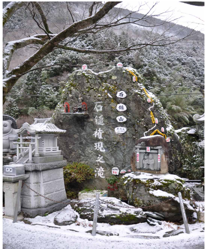
▲ 駐車場のミニ石鎚山